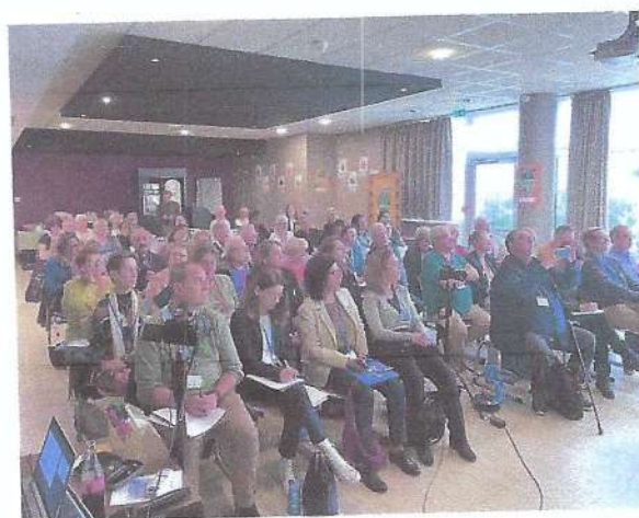
les participants et participantes à la conférence médicale