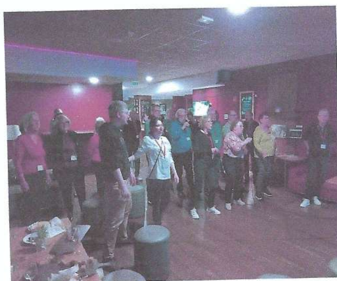
Après une journée studieuse une soirée de détente Karaoké.