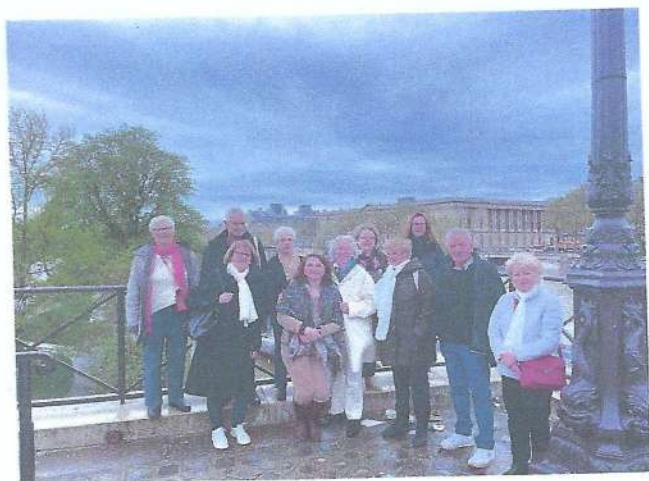
Balade dans Paris et visite de La Conciergerie et de la Chapelle Royale, pour les non-congressistes ne participant pas au Conseil d'administration de la Fédération FGCP.